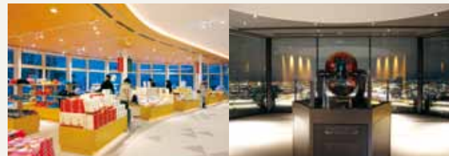
Große Auswahl an Souvenirs aus Hokkaido