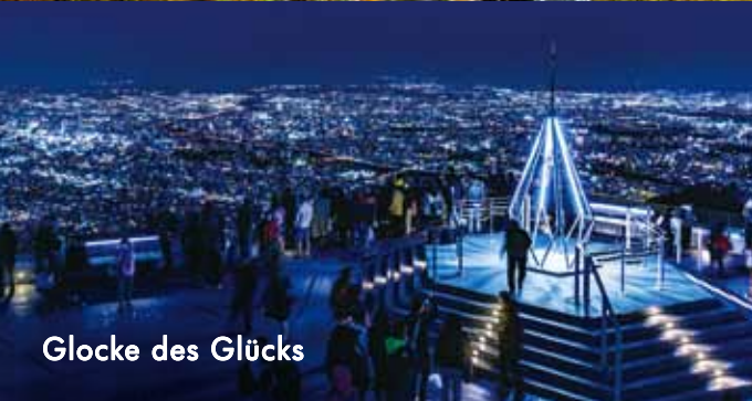
Glocke des Glücks