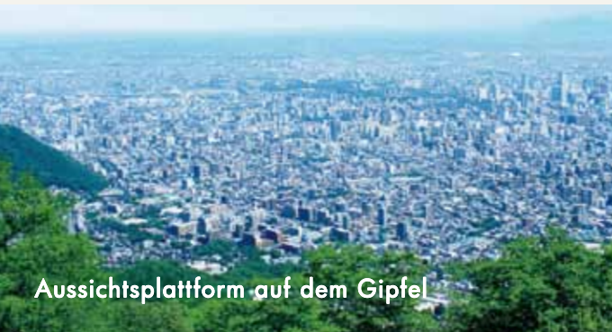
Aussichtsplattform auf dem Gipfel