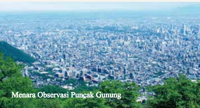
Menara Observasi Puncak Gunung