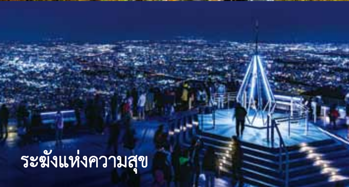
ระเบียงแห่งความสุข