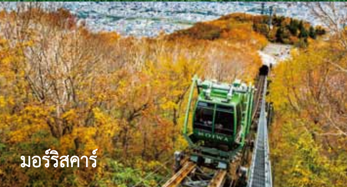
มอร์ริสการ์