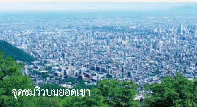
จุดชมวิวยอดนิยม