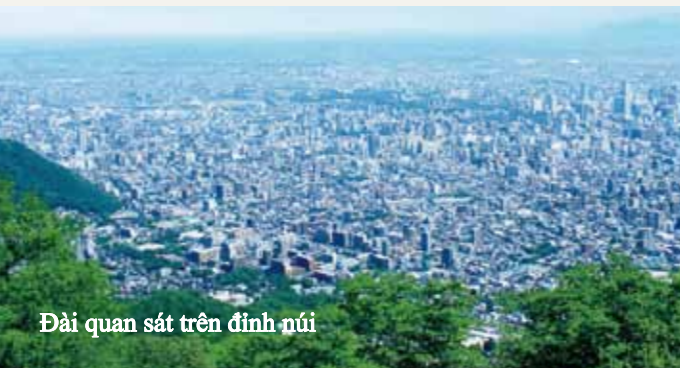
Đài quan sát trên đỉnh núi