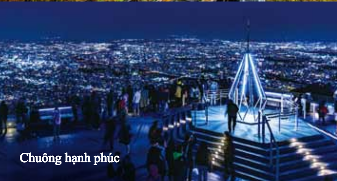
Chuông hạnh phúc