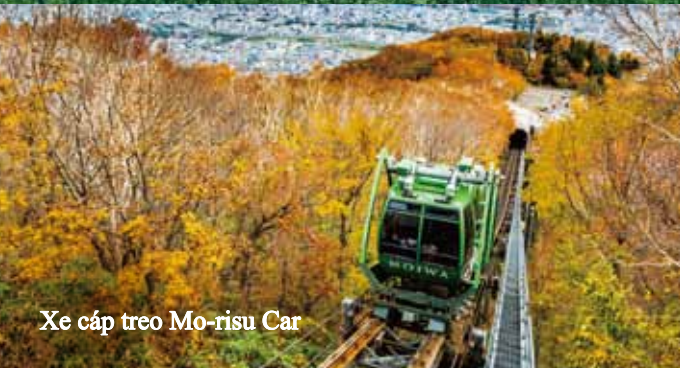
Xe cáp treo Mo-risu Car