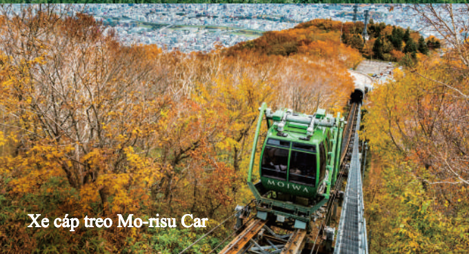
Xe cáp treo Mo-risu Car