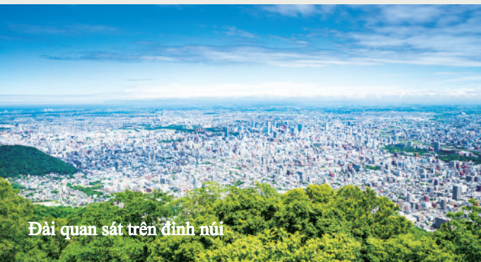
Đài quan sát trên đỉnh núi