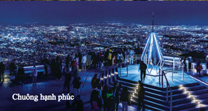
Chuông hạnh phúc