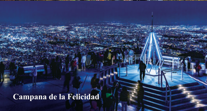
Campana de la Felicidad