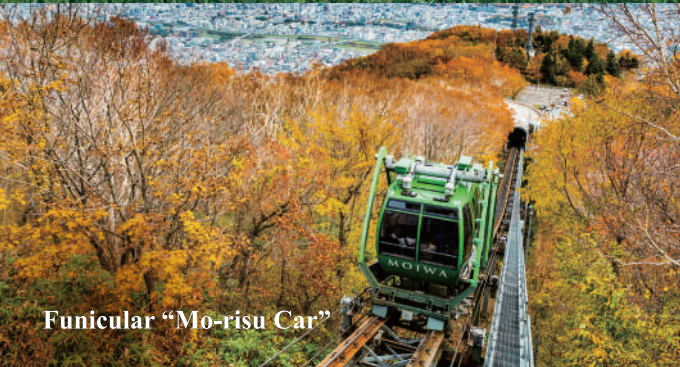
Funicular "Mo-risu Car"