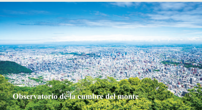
Observatorio de la cumbre del monte