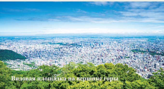
Видовая площадка на вершине горы