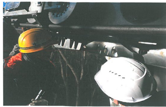
接続装置解体点検、搬器移