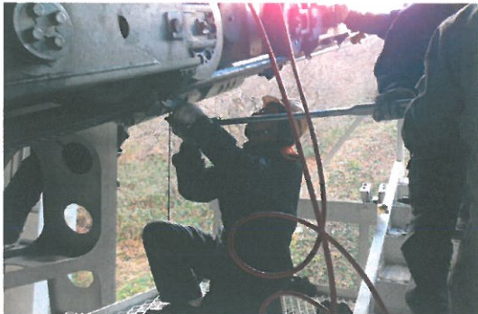
接続装置解体点検、搬器移