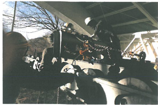
接続装置解体点検、搬器移