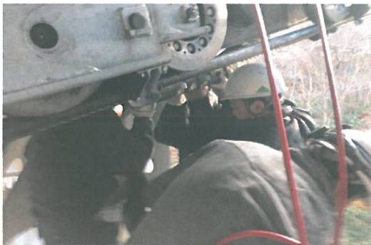
接続装置解体点検、搬器移