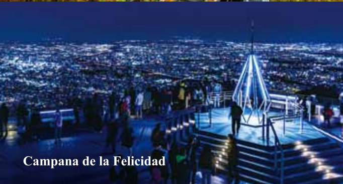
Campana de la Felicidad