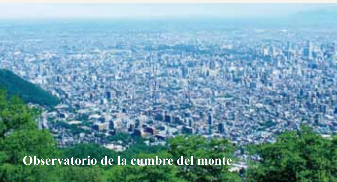
Observatorio de la cumbre del monte