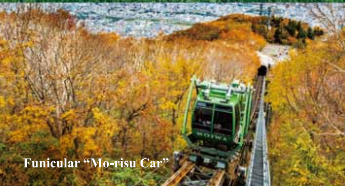
Funicular "Mo-risu Car"