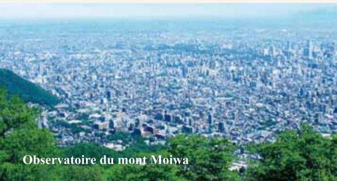
Observatoire du mont Moiwa