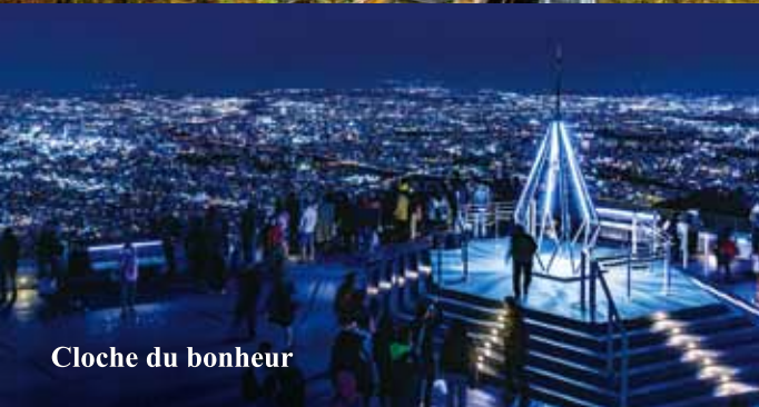
Cloche du bonheur