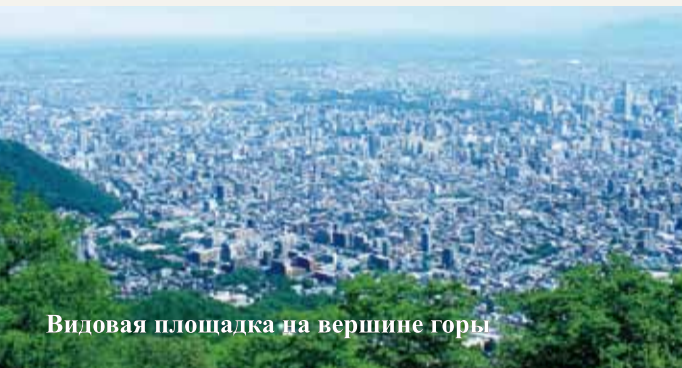
Видовая площадка на вершине горы