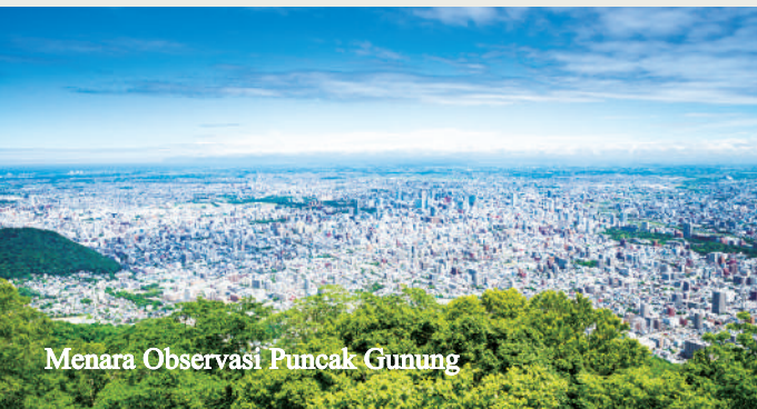
Menara Observasi Puncak Gunung