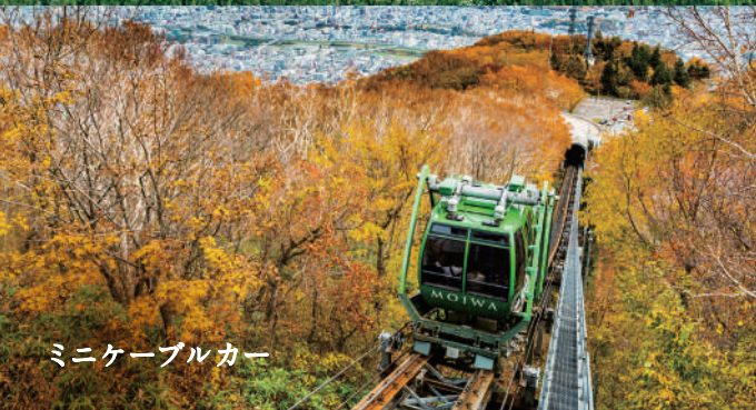
ミニケーブルカー