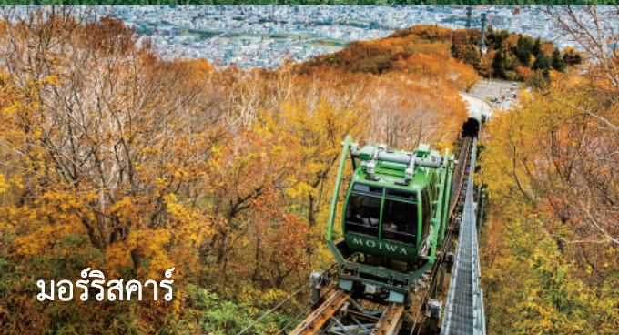
มอริริสการ์