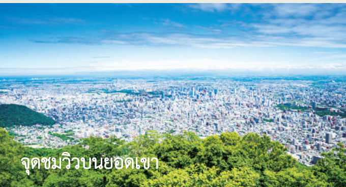
จุดชมวิวบนยอดเขา