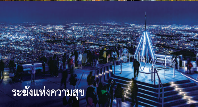
ระซังแห่งความสุข